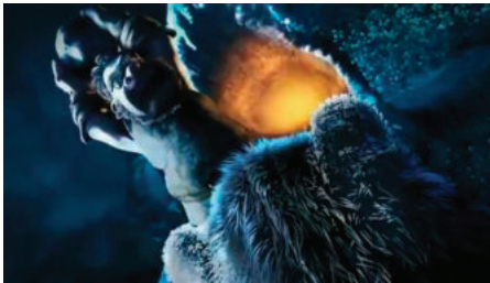
Кадр №4. Чоловік бореться з ворогом (Воїн)