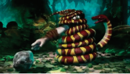
Кадр №2. Чоловік долає задушливі обставини (Борець)