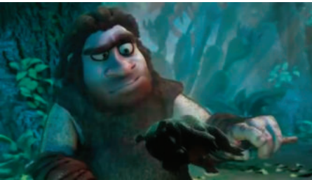
Кадр №3. Чоловік знайшов їжу (Годувальник)