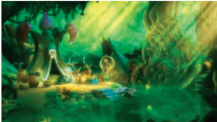
Кадр №1. Чоловік будує будинок (Будівник)

Перегляньте мультфільм до проведення заняття. Виділіть п'ять ключових кадрів. Збережіть кадри у вигляді зображень.