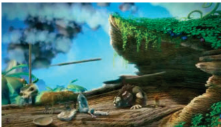
Кадр №5. Чоловік завоював серце жінки (Чоловік)

Після перегляду мультфільму подальша робота буде заснована на цих ключових кадрах.